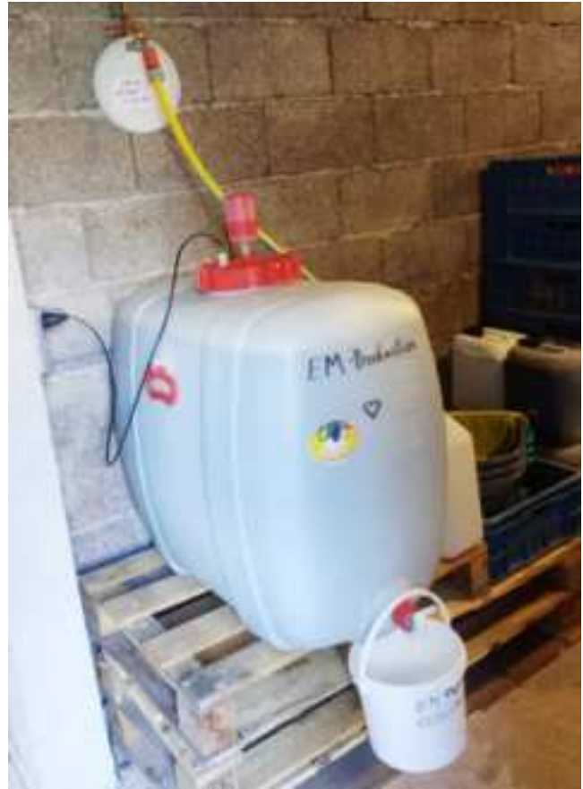
Foto links: In deze ton wordt keukenafval gegooid en daarover heen wordt EM gesproeid. Het keukenafval fermenteert daardoor en wordt later gebruikt in de grond als bemesting. Er is geen sprake van een rottingsproces dus.

Foto rechts: In deze bak wordt de EM gemaakt.